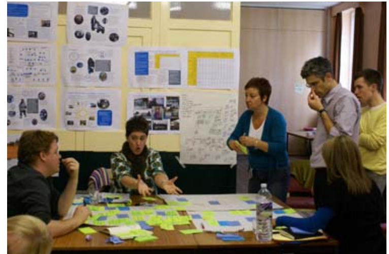
Social Innovation Lab for Kent (SILK) - intressant i Sverige?

Varför finns inte kommunla lab för kommunal organisation?